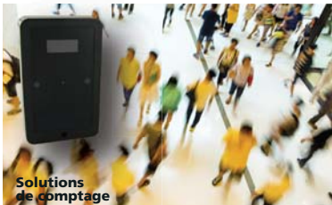
Solutions de comptage