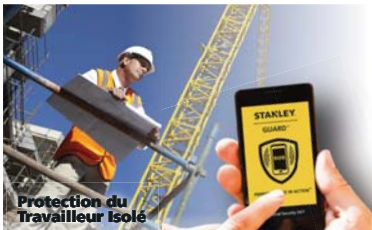
Protection du Travailleur Isolé