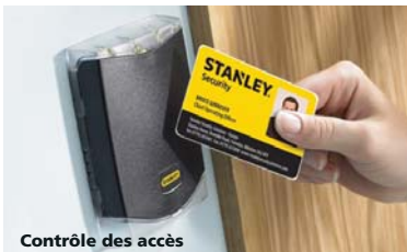
Contrôle des accès