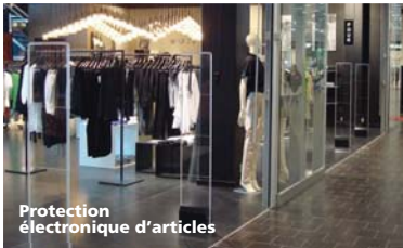
Protection électronique d'articles